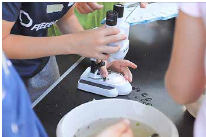
„Was draußen so alles kreucht und fleucht - Jugendliche betrachten beim Praxiskurs Junge Naturwächter gefangene Insekten unter dem Mikroskop.“