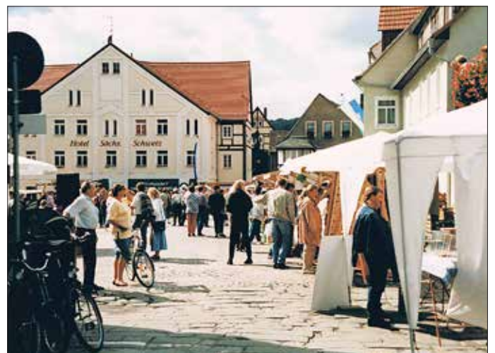
Stadt Wehlen, 1997