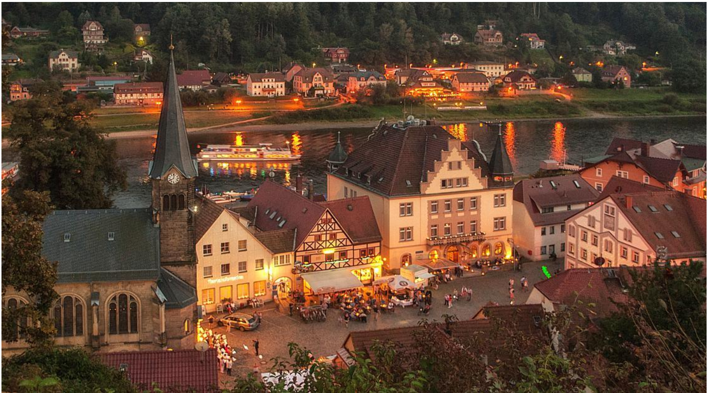
Bild 8: Vierte Nacht der 1000 Lichter am 10. September 2016 – Blick von der Burg über den Marktplatz und die Elbe hinüber nach Pötzscha.