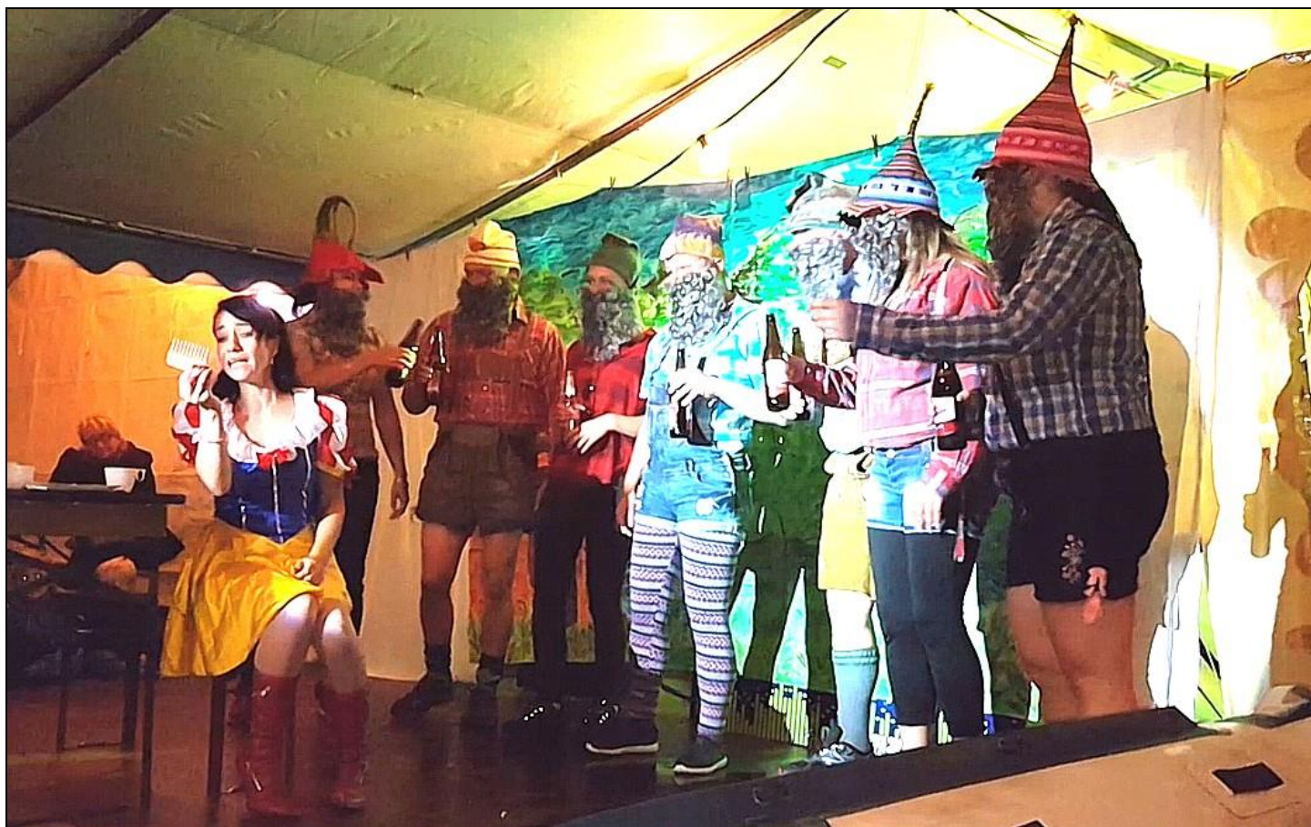
Bild 10: „Märchenhaftes – Schneewittchen – was wirklich geschah“. Aufführung der Kulturgruppe Pötzscha (KGP) zum Straßenfest des Vereins Lustige 7 e.V am 24.09.2016. Internet: www.Pötzscha.de