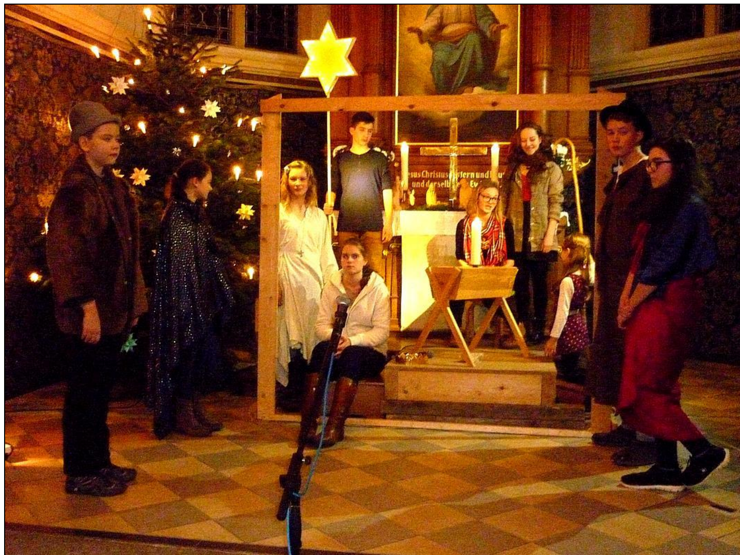
Bild 12: Christvesper am 24.12.2015 in der Kirche Stadt Wehlen – Krippenspiel