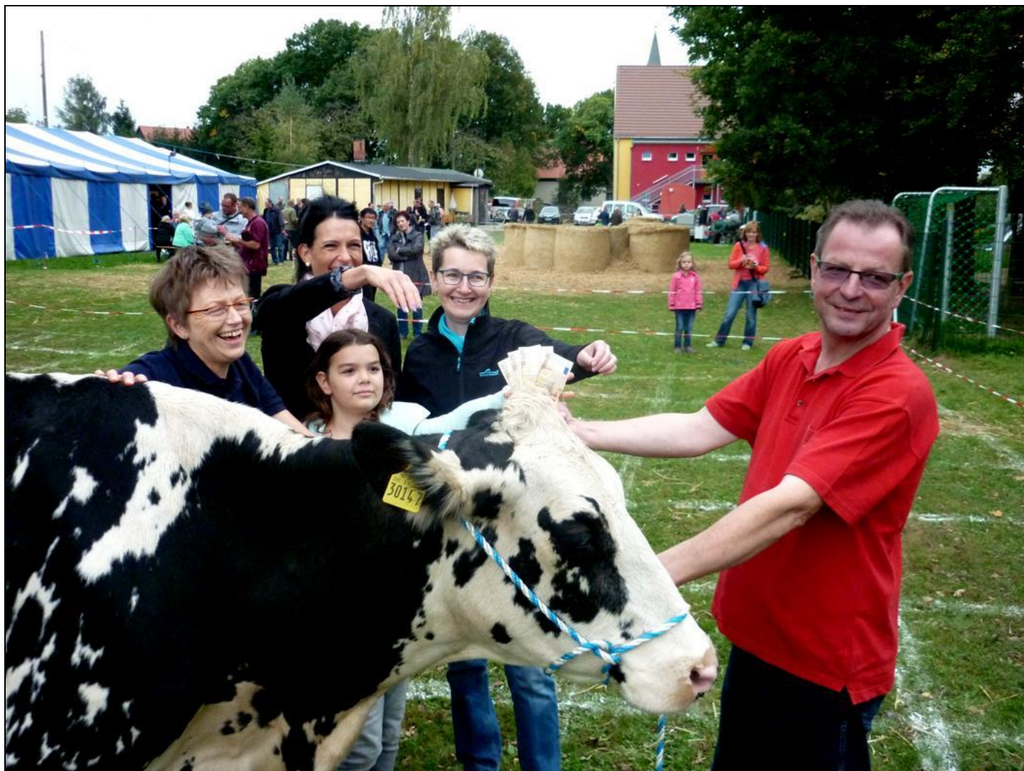
Bild 11: Die vier Gewinner(innen) der Kuhfladenwette zur Kirmes 2016 in Dorf Wehlen. Die Kuh mit dem blumigen Namen Malve vom Milchhof Fiedler war nicht faul, sie hatte ihre Fladen gleich auf vier Felder gemacht.