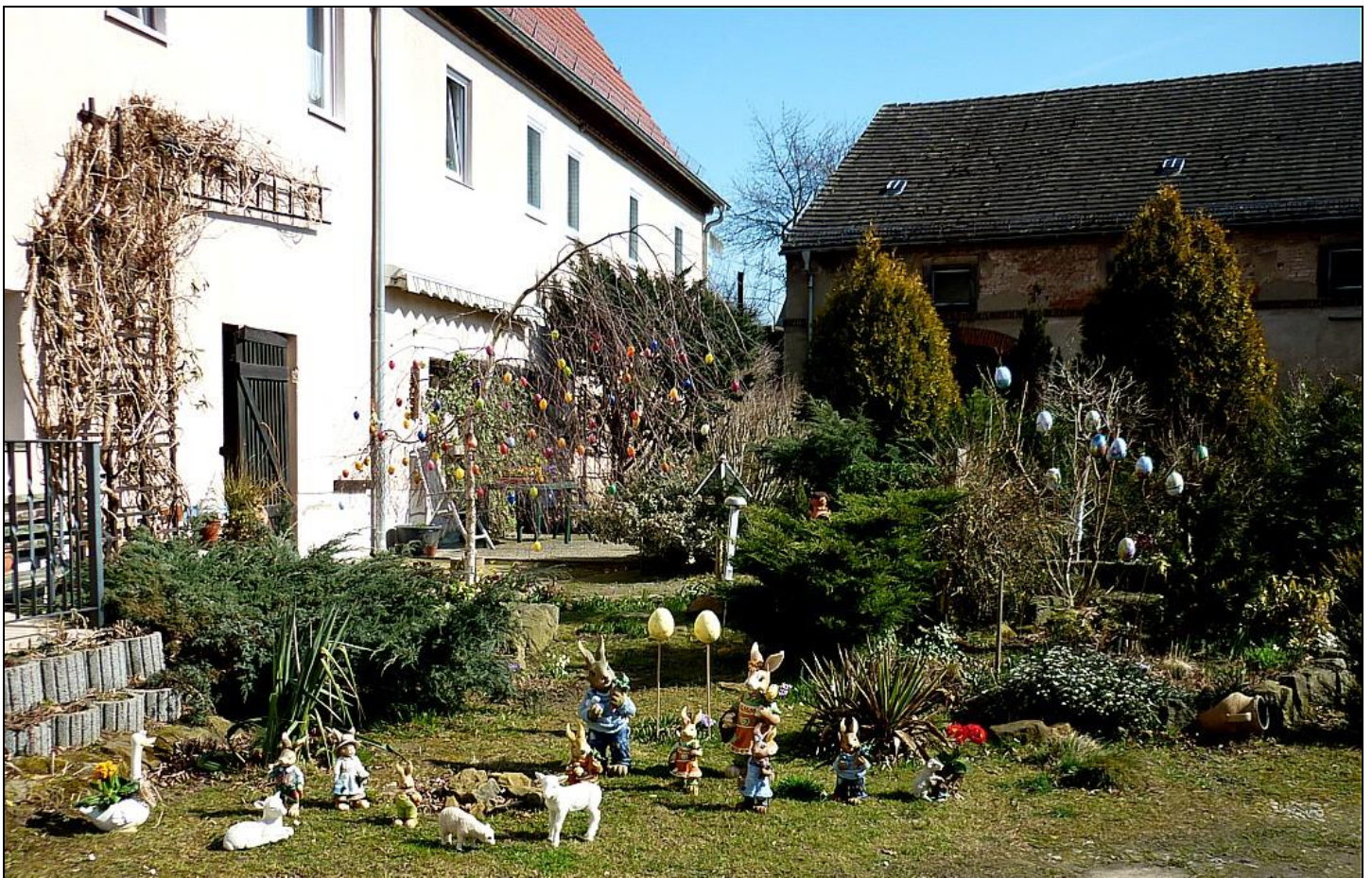
Bild 3: Lustige Osterdekoration im Bauernhof Gebert in Dorf Wehlen