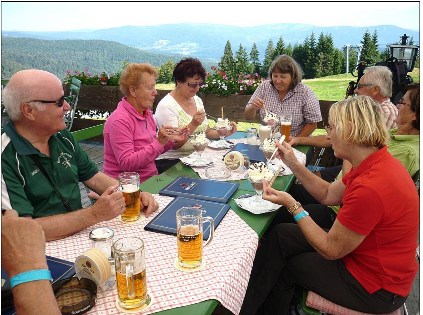
Bild 7: TuS-Wanderfahrt 2016 in den Bayerischen Wald. Nach dem Abstieg vom großen Arber haben wir uns eine Stärkung verdient !