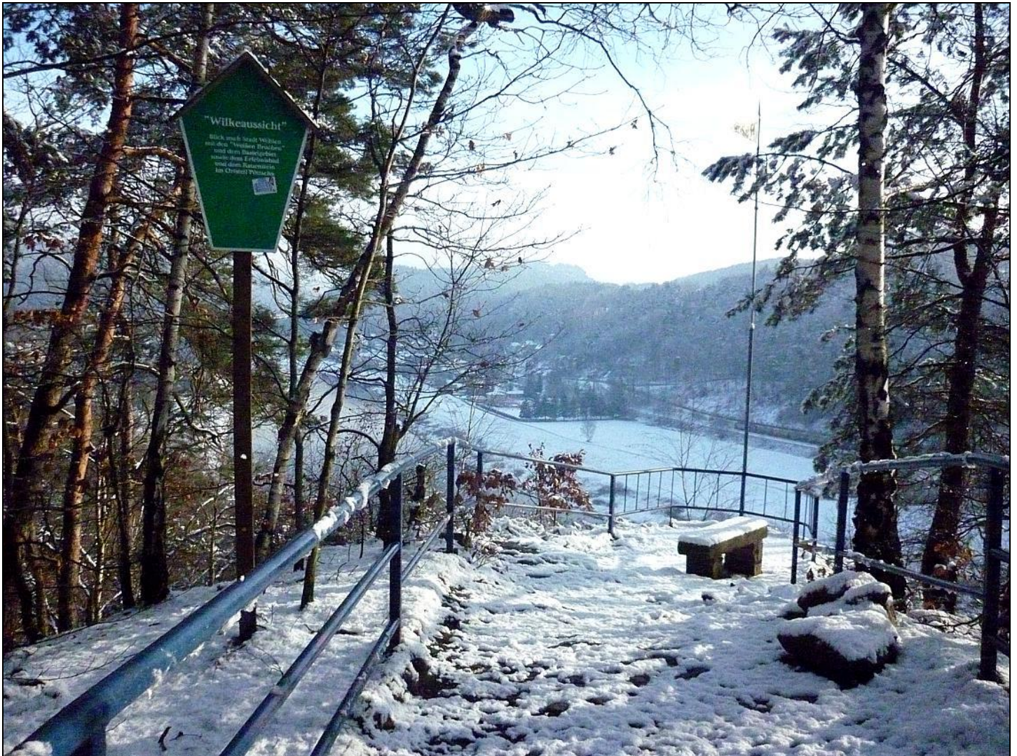
Bild 1: Wilkeaussicht – ehemals „Poltermanns Ruh“ - Blick auf die Elbe und Stadt Wehlen im Winter 2016/17