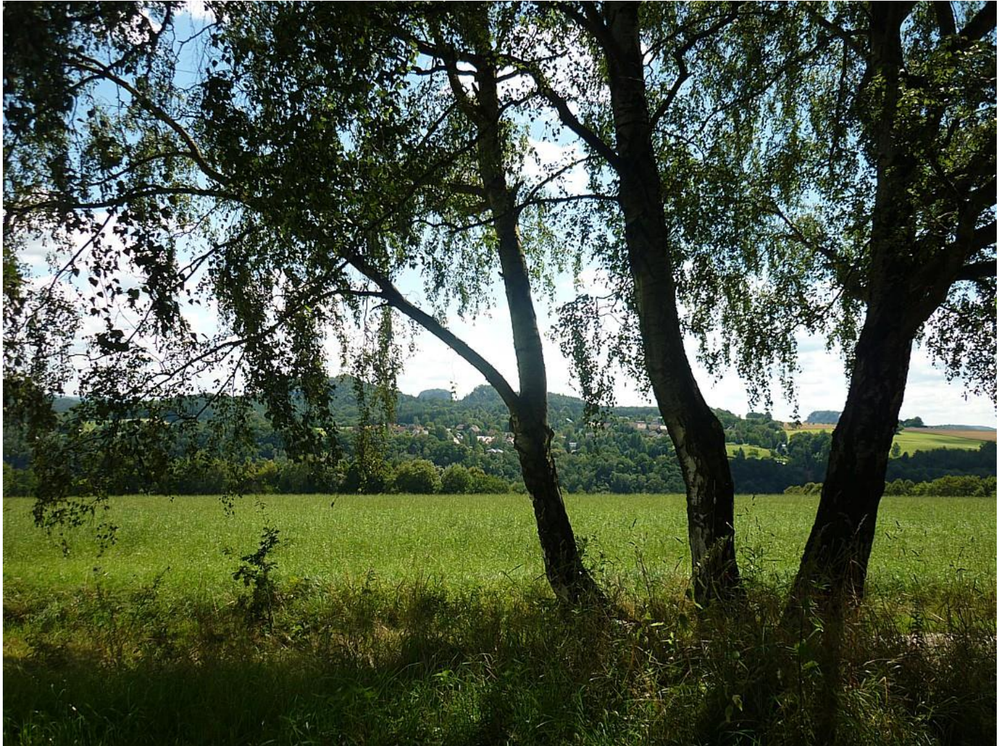
Bild 6 Vom Panoramablick an der Steinbruchstraße in Dorf Wehlen blickt man in Richtung Süden auf Naundorf, dazwischen liegt das Elbtal.