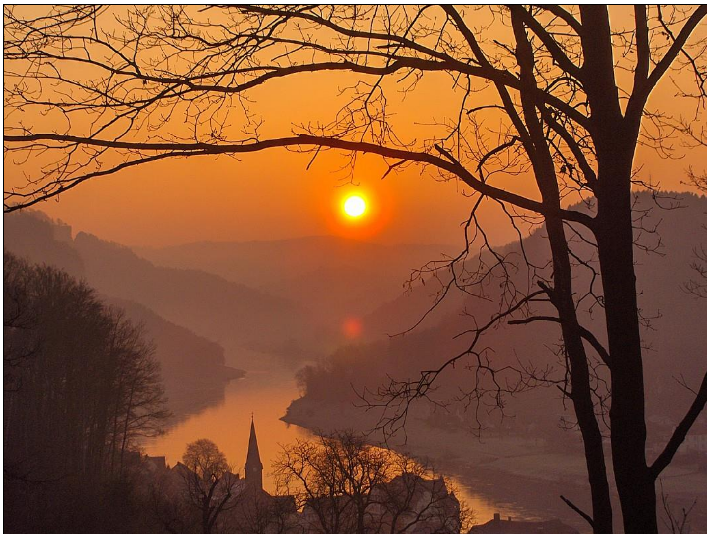
Bild 2: „Frühlingstag“ – Morgensonne über Stadt Wehlen, vom ehemal. Genesungsheim aus gesehen (Barbara Lammers, Stadt Wehlen)