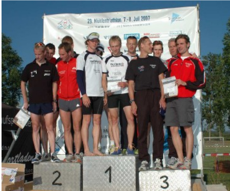
Team 2007 (Pirna)

2008 wurde dem TV Dresden das grüne Band für hervorragende Nachwuchsarbeit übergeben. Dieser Preis motiviert uns, im folgenden Jahr die sehr gute Nachwuchsförderung fortzuführen. Desweiteren denken wir an eine Erweiterung des Trainingsangebotes für den Breitensport . Damit soll eine Präsenz auf allen Strecken regional bis überregional geschaffen werden.