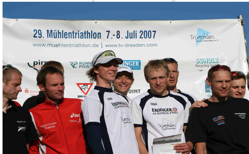
Team 2007 (Pirna)

gemeinsames Training / Gesprächsrunden / Vorträge / Präsentationen