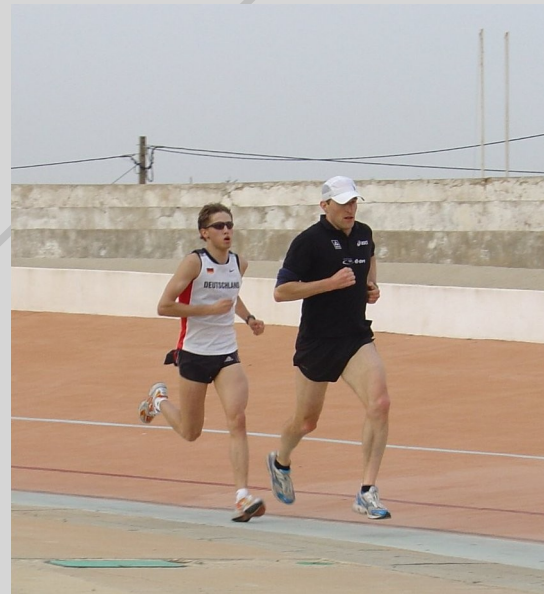
v.l.n.r. Team 2008, Trainingslager Portugal 2008